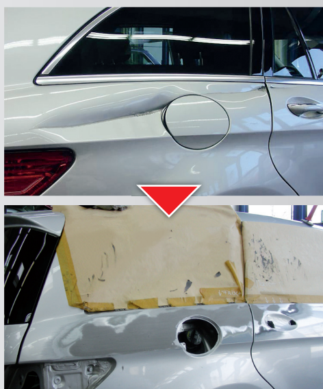
Produktový test v technickém středisku Allianz